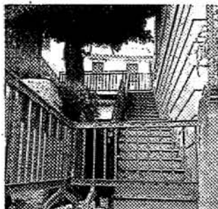
Il balcone e sottocornicione dell'ex scuola elementare di via Romana 4 e le transenne nel giardino

LAVAGNA (caq) «Cade a pezzi» l'ex scuola elementare di Cavi Borgo. Nei giorni scorsi il Comune è intervenuto per mettere in sicurezza il lato rivolto verso la via Aurelia dell'edificio di via Romana 4. Diverse parti dell'intonaco del sottocornicione e della pavimentazione dei balconi sono crollati. L'area sottostante del giardino è stata transennata per garantire la sicurezza dei passanti in attesa dell'intervento degli operai che hanno ripristina-